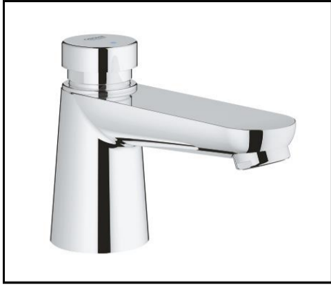
止水時間設定による吐水量